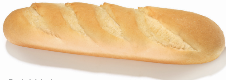
Escala 2:3 (cm)